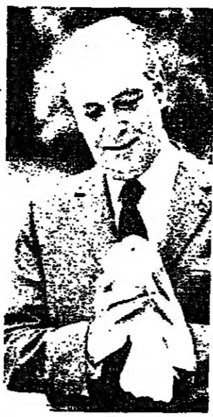
جاك سوفليه وزير الدفاع

اعلن ناطق بلسان قصر الاليزيه امس ، ان جاك سوفليه وزير الدفاع الفرنسي اسقط في تعديل وزارتي واستبدل به ايون بورج وهو وزير دفاعي سابق .